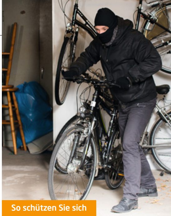
So schützen Sie sich